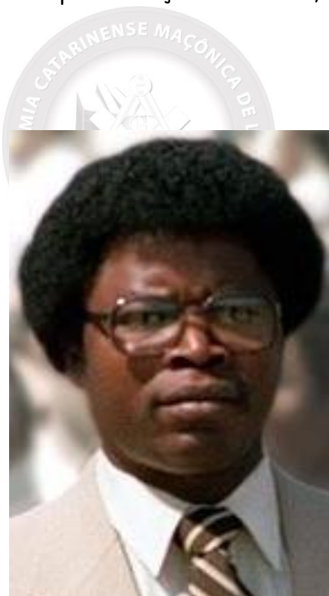
Fig. 8 - Samuel K. Doe, 21º presidente da Libéria (foto de 1982, em Washington, DC).

Comandando um grupo de soldados da tribo Krahn, o sargento Samuel Doe liderou um golpe militar em 12 de abril de 1980: atacou o palácio presidencial liberiano, matando e estripando o presidente e Grão-Mestre William Richard Tolbert e 26 empregados presidenciais. Treze membros do Gabinete, todos maçons, foram fuzilados publicamente numa praia, dez dias depois. Centenas de trabalhadores do governo e maçons fugiram do país, enquanto outros foram presos. Após o golpe, o sargento Doe assumiu o posto de general e estabeleceu um governo ditatorial assentado no Conselho da Redenção do Povo (PRC), composto por ele e 14 outros oficiais de baixa patente, todos proveniente de tribos liberianas. Os primeiros dias do regime foram marcados por execuções em massa, especialmente de maçons.