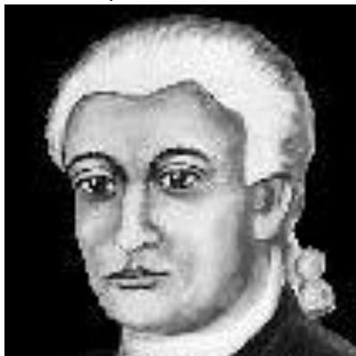
Fig. 1 - Desenho de Prince Hall ( The National Grand Lodge Free and Accepted Ancient York Rite Masons ).

Em janeiro de 1787, o Grão-Mestre Prince Hall e onze outros membros de sua Loja, pediram à Câmara dos Representantes dos EUA permissão para que os negros que estavam em circunstâncias intolerantes de desigualdade, como cidadãos americanos, se transferissem para um estado separado no exterior, com os seus próprios pastores negros e bispos e com a ajuda de congregações ou assistência. Prince Hall propõe que o Estado fosse em África, comprando terras e colonizando de forma mais civilizada. A Câmara dos Representantes não aceitou tal pedido. Prince Hall foi o primeiro a prever a existência de um país livre em África - Libéria.