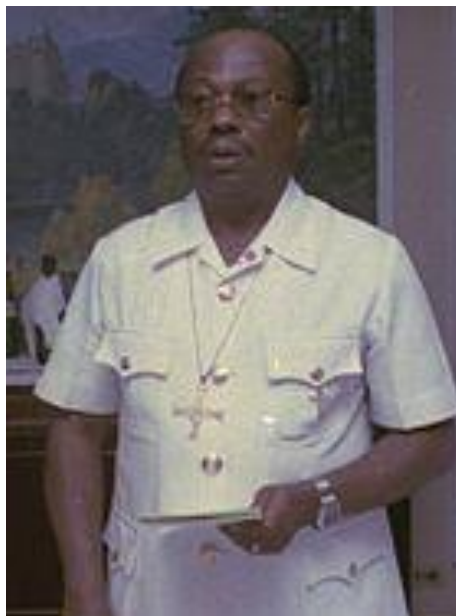
Fig. 9 - Ir. William R. Tolbert, Jr, 20º presidente da Libéria (foto de 1978, em Washington, DC).