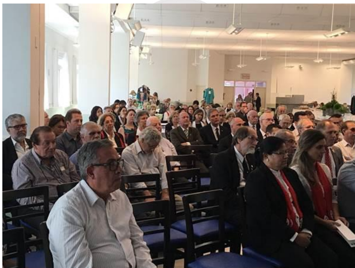
Parcial do público e acadêmicos que prestigiaram o ato.