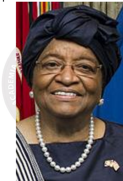
Fig. 11 - 24ª Liberian President Ellen Johnson Sirleaf, prêmio Nobel (foto Pentágono, Washington, 2015).

Ellen J. Sirleaf (Fig. 11) nasceu em 1938, em Monróvia. É considerada américo-liberiana, embora seus ancestrais descendam da tribo Kru e de alemães. Serviu como Ministra das Finanças no governo do Presidente Tolbert, até 1980, quando se refugiou em Washington, nos EUA. Trabalhou, então, no Banco Mundial. É divorciada e foi casada com um maçom. Sirleaf estudou economia e políticas públicas na Universidade de Harvard (EUA), obtendo Master of Public Administration . Tem o título honorário de Doctor of Laws , pela Universidade de Harvard. Em 2005, ela venceu as eleições presidenciais liberianas e assumiu a presidência em 2006. Foi reeleita em 2011, com mandato até 2017. É a primeira mulher eleita chefe de estado na Libéria.