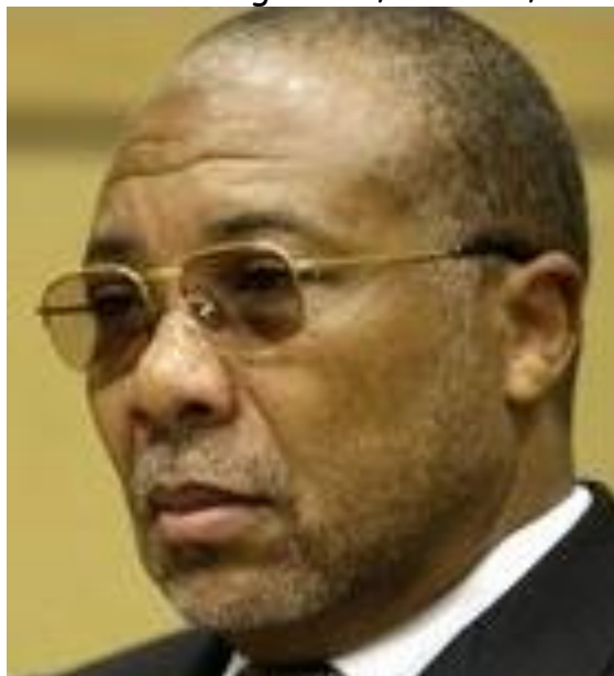
Fig. 10 - Charles Taylor, 22º presidente da Libéria (foto Associated Press, 1998).

Em 1997, Charles Taylor foi eleito o 22º presidente da Libéria. Mas uma grande insatisfação popular culminou na 2ª Guerra Civil da Libéria (1999-2003). Taylor renunciou em 2003 e foi para o exílio na Nigéria. Foi preso pelas autoridades das Nações Unidas e foi a julgamento no Tribunal Especial de Haia. Foi considerado culpado em 2012 pelo terror, assassinato e estupro, e condenado a 50 anos de prisão. Está na Penitenciária de Haaglanden, em Haia, Holanda.