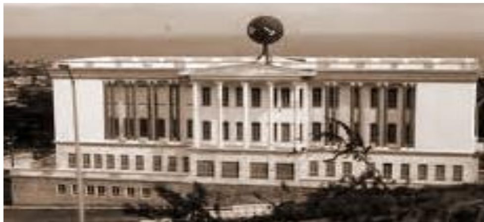
Fig. 6 - Antigo Templo da Grande Loja dos Maçons, A.F & A.M - República da Libéria. Hoje abandonado.

Nos anos 70 do século XX, havia 17 Lojas Prince Hall de Maçons Livres, Antigos e Aceitos na República da Libéria, com cerca de 1.100 membros (média de 64 maçons por Loja). O rito utilizado pelos maçons liberianos é o Rito de York (norte-americano). O sentimento da população tribal, que inicialmente, não tinha nacionalidade liberiana, era de que as decisões sobre a nação eram feitas em segredo por trás de portas fechadas dos templos maçônicos.