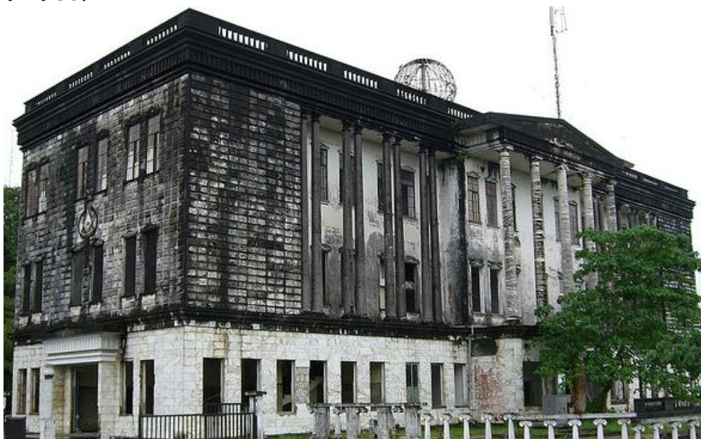
Fig. 7 - Antigo Templo da Grande Loja dos Maçons, A.F & A.M - República da Libéria. Hoje abandonado.

Em 1980, era Presidente da República, William Richard Tolbert, Jr. (Fig. 9). William R. Tolbert, Jr., nasceu em Bensonville, a 35 km de Monróvia, em 1913, e foi morto pelo golpe de estado em 1980. Seus ancestrais eram da Carolina do Sul, EUA. Era pastor batista. Em 1965, foi eleito Grão-Mestre da Maçonaria na Libéria. Tolbert foi presidente da Organização de Unidade Africano de 1979-1980.