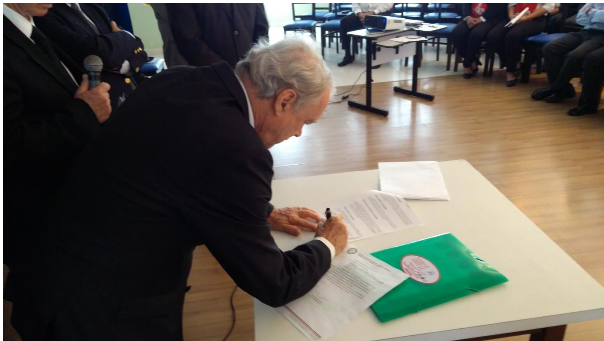
Momento da assinatura do Acordo de Cooperação Técnica entre ACML & Potências Maçônicas catarinenses.