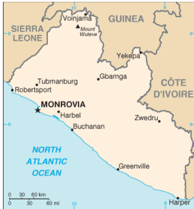
Fig. 4 - República da Libéria.