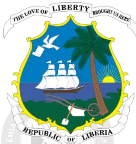
Fig. 3 - Brasão e Lema da República da Libéria - Motto: "The love of Liberty brought us here" - Lema: "O amor pela Liberdade nos trouxe aqui".