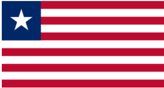
Fig. 2 - Bandeira da Republic of Liberia , baseada na dos EUA. Listas vermelhas e brancas; estrela branca envolta num quadrado azul, como a bandeira dos EUA.